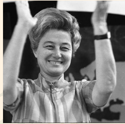
Chiara Lubich – 03/07/1969

«Hemos tomado nueva conciencia de que evangelizar para nosotros significa, antes que nada: vivir, ser, testimoniar, pero luego, también hablar, anunciar». Varias circunstancias permiten a Chiara Lubich enfocar el núcleo esencial de nuestro anuncio: Dios es Amor. Este es el grandísimo descubrimiento que ella hizo personalmente en plena guerra mundial y que anunció enseguida a todos: a las amigas, padres, parientes, hombres y mujeres de las culturas y condiciones sociales más variadas. «Dios nos ama inmensamente!». Y suscitó una respuesta: «...y nosotros hemos creído en el Amor».