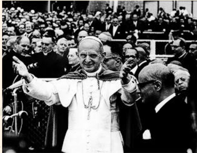
San Pablo VI, Manila el 29 de noviembre 1970

San Pablo VI, papa: "Cristo, nos conoce y nos ama, compañero y amigo de nuestra vida, hombre de dolor y de esperanza".